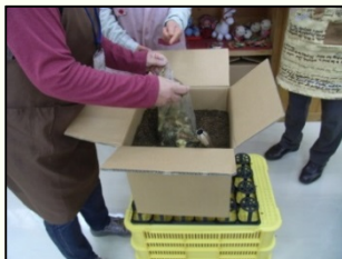
「ダンボールコンポストで堆肥化講座」