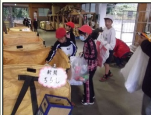
小学4年生「環境学習講座」