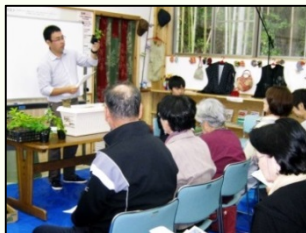
農高教師による「グリーンカーテン講座」